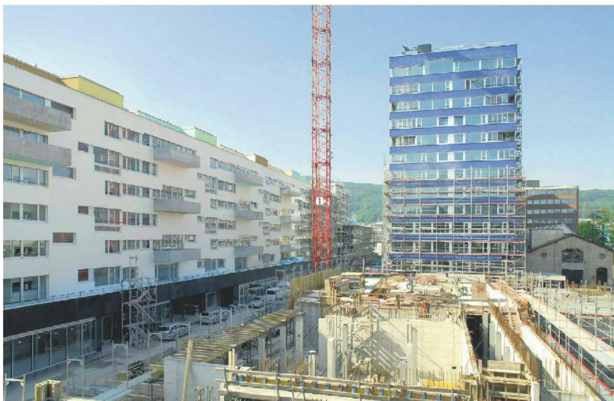
Die Wohnüberbauung «James» im Jura: links das Langhaus, im Hintergrund das Hochhaus samt Event-Halle (ganz rechts).