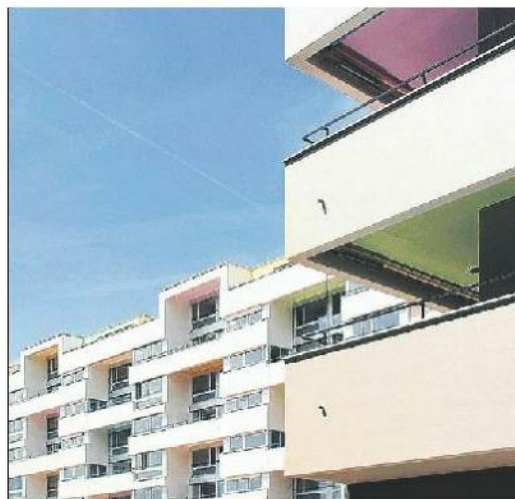
Verschiedene Farben sorgen für Abwechslung.

Auch bei den Wohnungen im Langhaus wurde die Flexibilität in der Raumaufteilung zum Grundprinzip gemacht. Die geräumigen Maisonettewohnungen sind aber in ihrer Grösse und Zimmerzahl eher auf Familien ausgerichtet. Die Wände und Decken der Nasszellen sind in Kombinationen aus Pink, Rosé, Grün, Gelb, Türkis und Mokka gestrichen. Zur Hochhaus-Seite hin sind den Wohnungen grosse Balkone vorgehängt. Auf der gegenüberliegenden Seite haben sie zweigeschossig eingezogene und gegeneinander verschobene Loggien, die durch ihre Höhe sehr viel Licht in die beachtliche Raumtiefe der Wohnungen lassen. Trotz der Dichte der Bebauung zeichnen sich die Maisonettewohnungen durch eine maximale Privatheit aus. Das Projekt «James» des Architekturbüros Patrick Gmür hat mit seiner grossstädtischen Geste eine gestalterische Antwort auf das schwierige, heterogene Umfeld gefunden und wirkt für das Quartier Albisrieden identitätsstiftend.